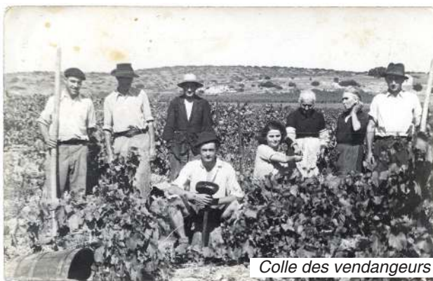
Colle des vendangeurs